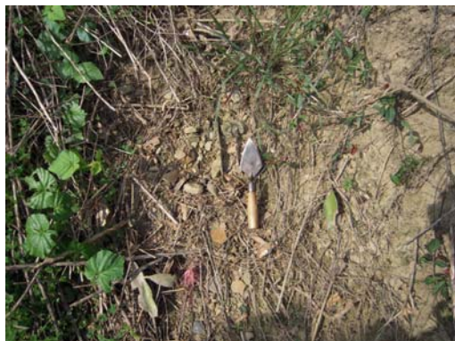
圖說：散落於地表之夾砂紅陶