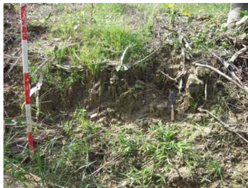
圖說：福德正神後方之文化層斷面